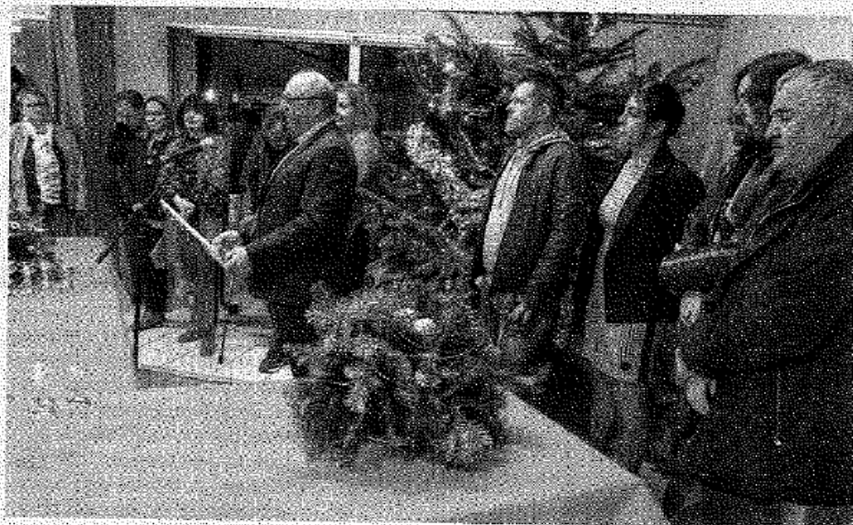
Le maire et son conseil municipal sont au plus près des administrés, c'est ce qui sort du discours du maire.

Par ailleurs, un vaste programme de curage de fossés est engagé. Suivi du dossier de la réserve foncière, mise en conformité des lieux recevant du public, réfection de canalisations d'eau