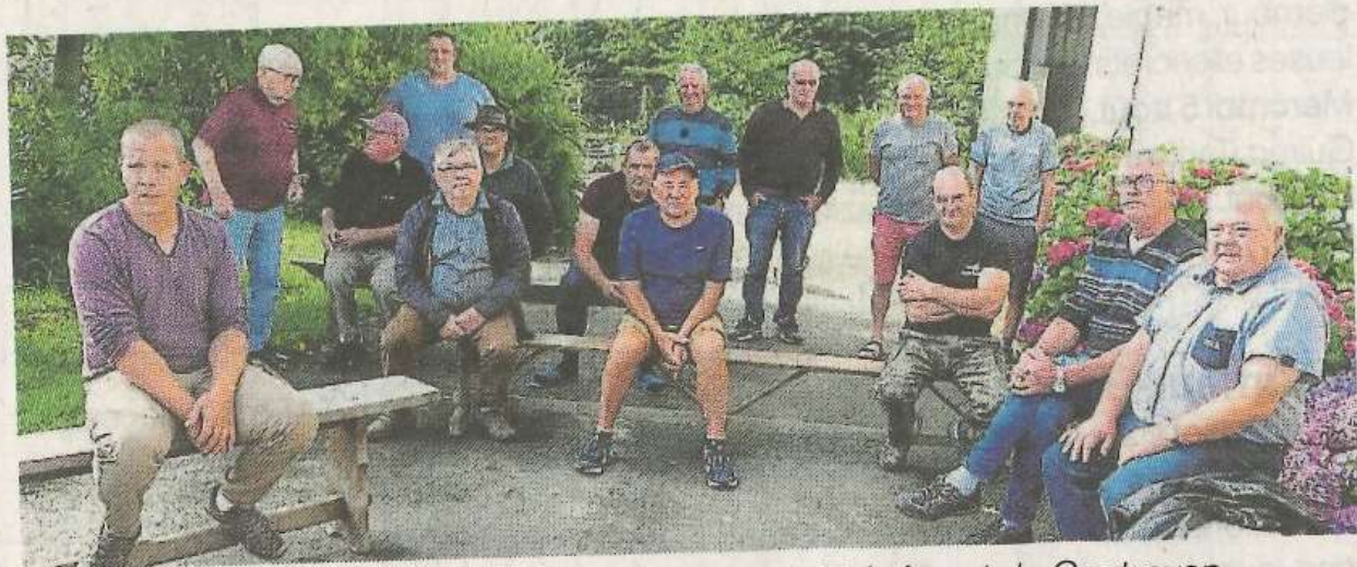
La société de chasse regroupe les chasseurs de Trézény et de Coatréven.