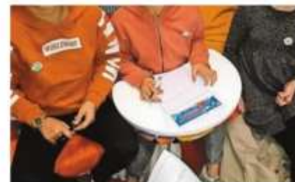
Les élèves travaillent en équipe sur le texte de la « Twictée ».

Le dispositif séduit plus de 400 enseignants, du CP au lycée. Il s'appuie notamment sur la répétition qui facilite