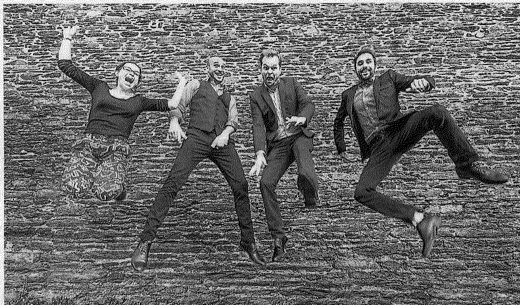
Entre standards de jazz, mélodies populaires et classiques de Disney, l'ensemble Climax donnera une prestation « a cappella », le 11 août, à l'église de Ploumilliau.

Les organisateurs ont été sollicités par Les Amis de l'église Saint-Pierre de Coatréven et le Circuit des Chapelles désireux de recevoir des événements dans leur commune. La première association accueillera Plaisir