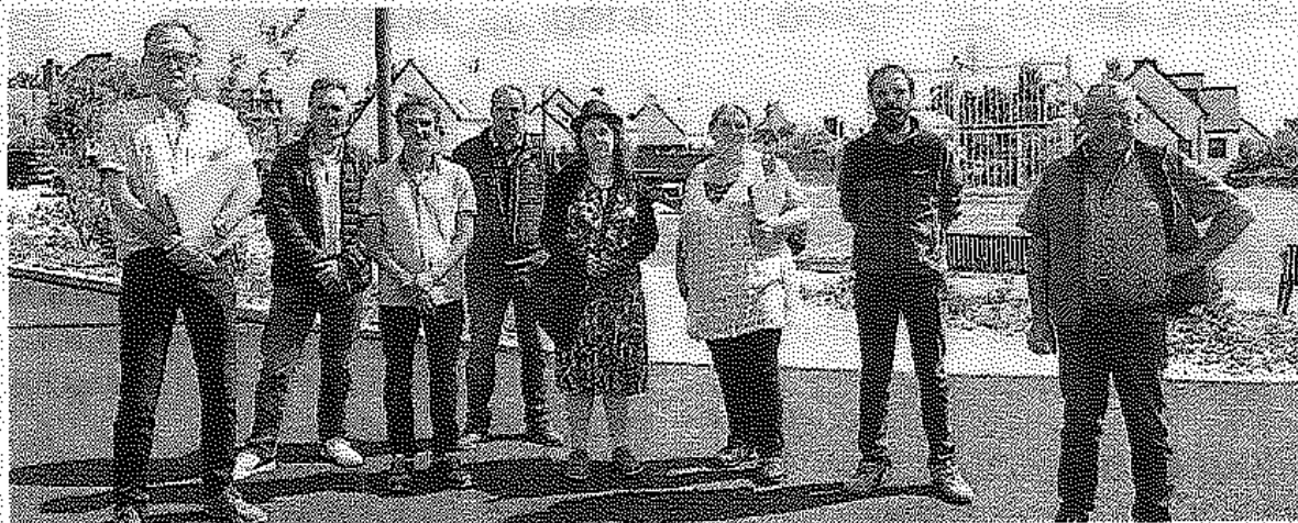
Élus et entreprises présents à la réception des travaux d'aménagement de la place des Bosquets